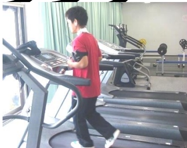
運動中の健康管理